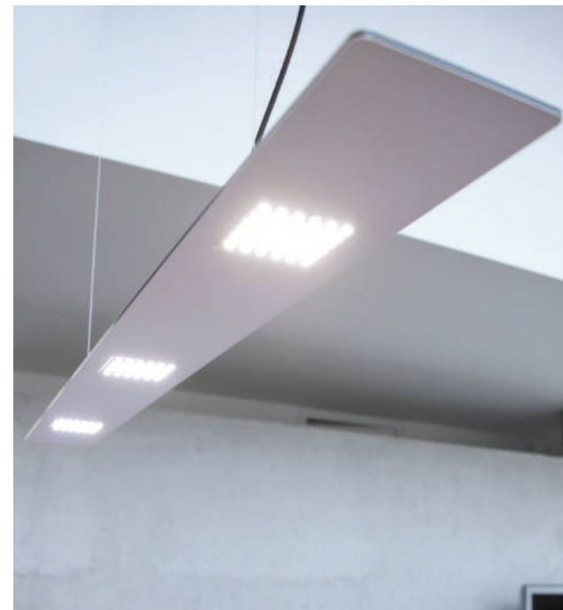
Filigran im Raum schwebende Leuchte

Lablight P überzeugt in den verschiedensten Raumsitua- tionen durch moderne Linien- führung und elegante optische Zurückhaltung und durch gleichmäßig helle Lichtverteilung.